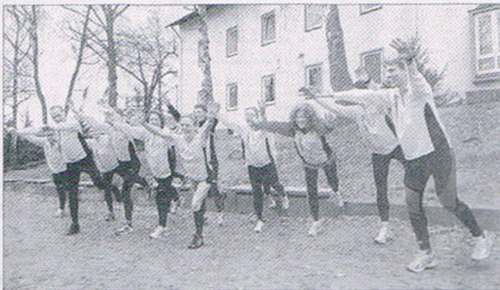
Vor dem Laufen kommt das Aufwärmen: Die Marathon-„Ultras“ vor der Steinbacher Jugendberge.

Am Samstag bekamen die Fördergruppe der Deutschen Ultramarathon-Vereinigung (DUV) einen ersten bleibenden Eindruck von der Umgebung. Die unter anderem aus Köln, Magdeburg und Würzburg angereisten Eiteläufer zeigten sich begeistert ob der malerischen Landschaft, verglichen die Gegend um den Donnersberg mit dem beliebten Touristenort Biel in der Schweiz. Für die „Ultras“ der Langlaufszene bedeutet das eine Menge: Bei Strecken zwischen 50 und über 250 Kilometern in der Spitze ist das, was sich neben der Asphaltspur oder dem unbefestigten Laufweg abspielt, keine Nebensächlichkeit. Die Landschaft dient als willkommene Abwechslung von den körperlichen Strapazen, beruhigt die beanspruchte Läuferseele, kühlt das Gemüt. Sehr wohl registrierten die Athleten, was um sie herum geschieht. Aus ganz rationalen Gründen: Was passiert als nächstes? Kommt ein Berg, geht es durch eine Ebene, lauf ich durch schattige Wälder oder auf offenem, für Wind und Wetter anfäll-