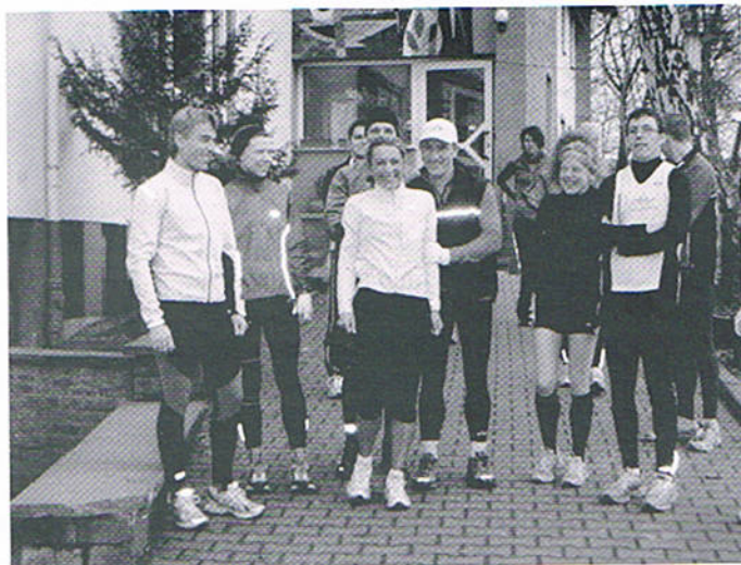
Spaß! Stretching! Und endlich auch laufen!