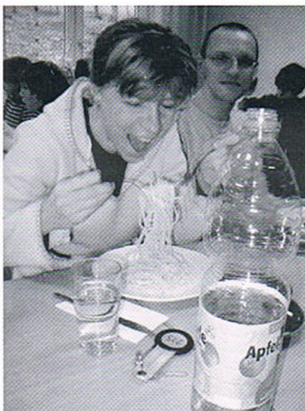
Pasta bis zum „Geht nicht mehr!“

Der Samstagmorgen begann mit einem ausgiebigen Frühstück. Danach fuhren wir gemeinsam zum Westpfalz-Klinikum in Rockenhausen. Dort sollte bei uns ein „TÜV“ durchgeführt werden, d. h. wir wurden auf Herz und Lun-