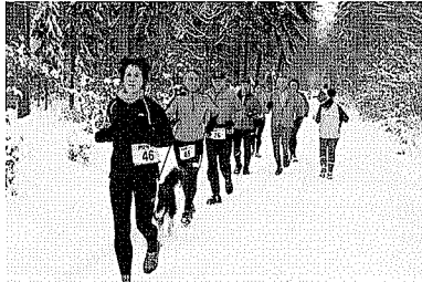
bis zu 25 km durch den verschneiten Wald