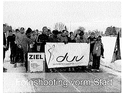
Fotoshooting vorm Start